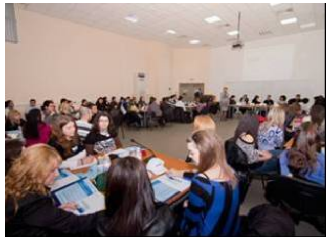
March 2011, Young entrepreneur's night (Ruse)

Изграждане на партньорство на Русенския университет с бизнес средите за високо качество на обучение