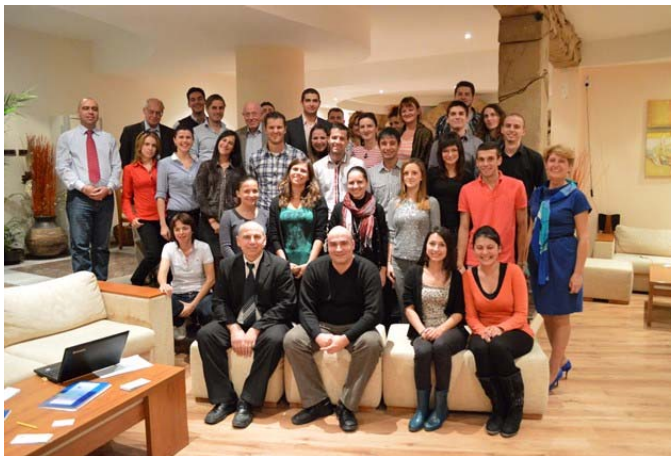
Лятно училище по технологично предприемачество - 2013