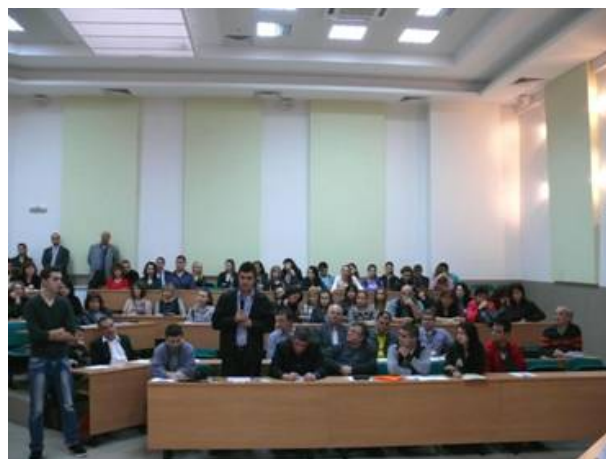
Работна среща „Научени уроци“ с участието на ментори, академични наставници и студенти – 30.10.2013 г.

Изграждане на партньорство на Русенския университет с бизнес средите за високо качество на обучение