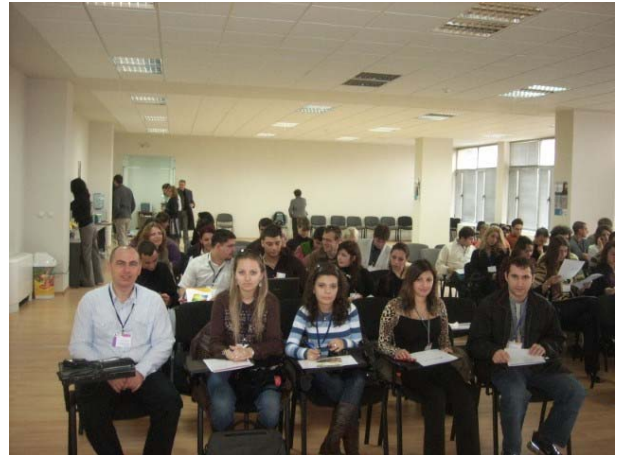
Национално обучение на студенти в Сградата на Нестле, София, 2009 г.