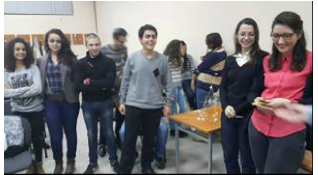
Семинар по младежко предприемачество за Start-it-Smart финансиране и опции за развитие на бизнес инициатива, 11-12 ноември 2014