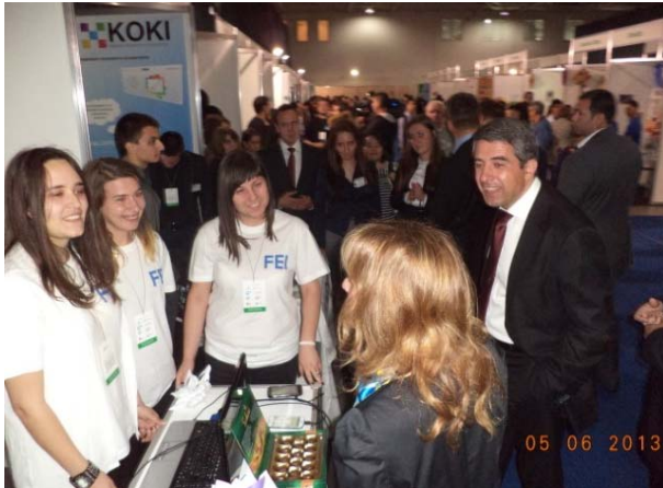
Среща на Учебната компания за студенти EUPHORIA с Президента на Република България - г-н Росен Плевнелиев, 05.06.2013 г., София.