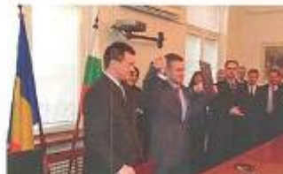
Signing of the Agreement for Cooperation and Mutual Assistance regarding the Development of BRIE between the Government of Romania and the Government of the Republic of Bulgaria by Solomon Pașoi, foreign minister of Bulgaria, and Mihai Ungureanu, foreign minister of Romania

The host cities of BRIE, Ruse and Giurgiu, are perfectly located to breathe today's spirit of togetherness in Europe. Mirroring each other on the Bulgarian and the Romanian banks of the Danube and connected by a bridge, they have their direct destination to ten European countries along the river. Since 2007 the border line